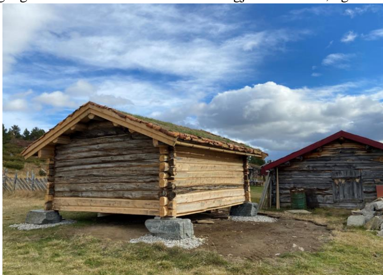
Bilde: Geithus og kokhus i Kvitdalen