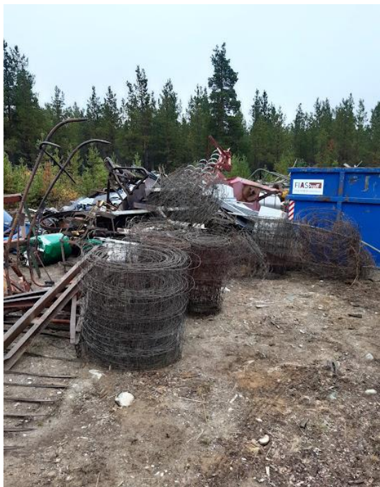
Bilde: Mye gjerdemateriell ble innlevert til Follidal Bondelag sin årlige metallskrotinnsamling. Bildet er tatt på oppsamlingsplassen på Krokhaug.

En god del har skjedd med gjerdeaksjonen gjennom 2021.